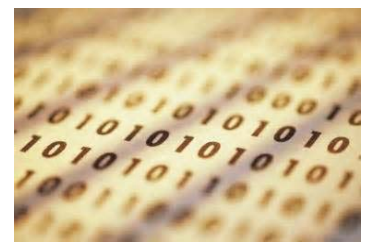
Cifras del sistema binario