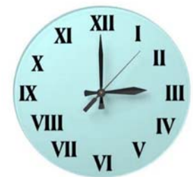
Reloj con números romanos

Como ya sabes, multiplicar dos números naturales es equivalente a sumar uno de ellos consigo mismo tantas veces como indica el otro.